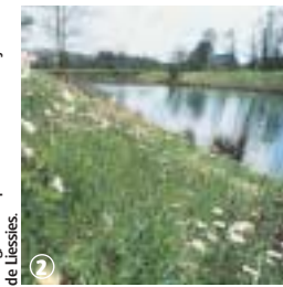
Etang, Parc Départemental de l'abbaye de Liessies.