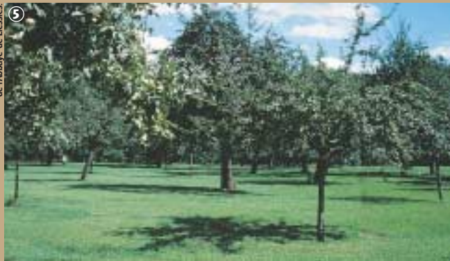
Le verger, Parc Départemental de l'Abbaye de Liessies.

Le site est toujours l'objet de toutes les attentions, afin qu'il demeure et encore pour longtemps un lieu de tranquillité et de rencontre avec la nature.