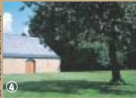
Le « Bûcher aux Moines »

vail des moines tout au long des siècles. De plus, quelques trésors ont pu être sauvés. Une balade dans le domaine favorise la rencontre avec une faune et une flore riches et variées : buses et éperviers se régalaient de la présence d'essences aquatiques pour le moins alléchantes !